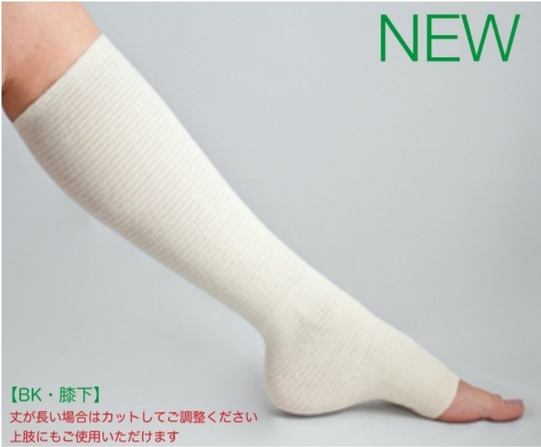
【BK・膝下】 丈が長い場合はカットしてご調整ください 上肢にもご使用いただけます