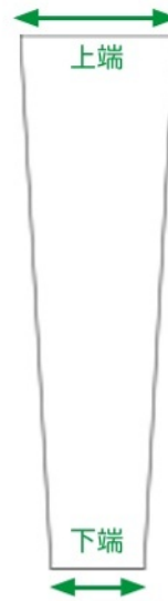
製品形状の イメージ図